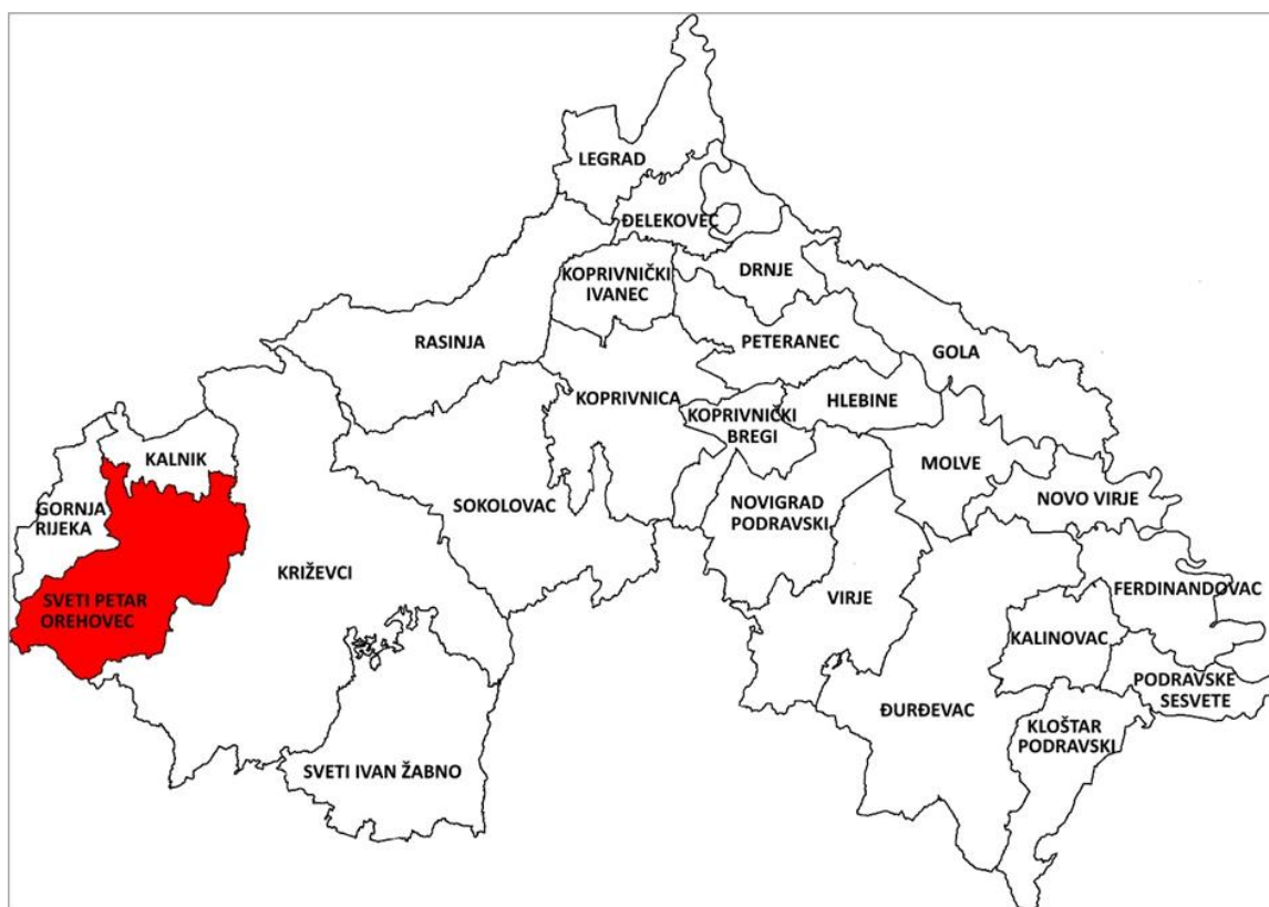
Slika 1. Položaj Općine Sveti Petar Orehovec u Koprivničko-križevačkoj županiji

Općina Sveti Petar Orehovec nalazi se u središnjem dijelu sjeverozapadne Hrvatske, odnosno zapadnom području Koprivničko–križevačke županije.